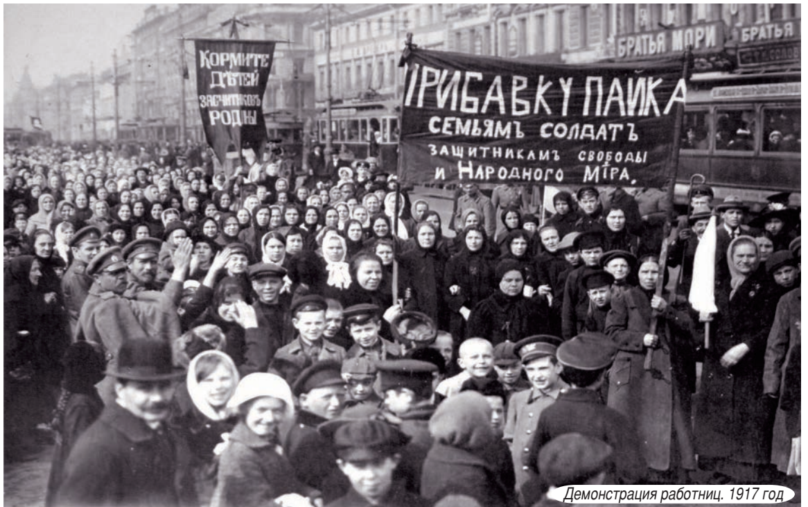
Демонстрация рабочих. 1917 год

На заседание Совета ФПОО приглашены члены Контрольно-ревизионной комиссии ФПОО, председатели Координационных советов организаций профсоюзов муниципальных образований и другой профсоюзный актив.