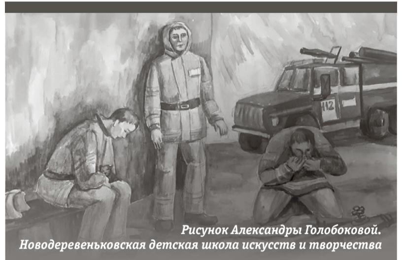
Рисунок Александры Голобоковой. Новодевяньковская детская школа искусств и творчества

Спасибо тебе, прабабушка, за твой труд, за то, что своим примером показала мне, как значим, как прост и в то же время велик человек труда. На нем-то, на этом труженике, будь он крестьянином или заводским рабочим, водителем или пекарем, строителем или слесарем, и держится страна.