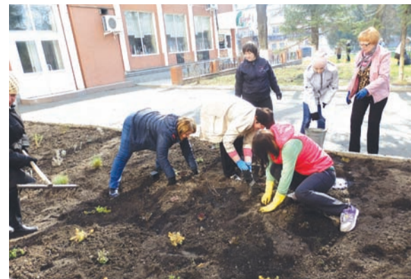
Профсоюзные активисты трудились с хорошим настроением

На Орловщине проходит экологический двухмесячник общероссийской акции «Дни защиты от экологической опасности».