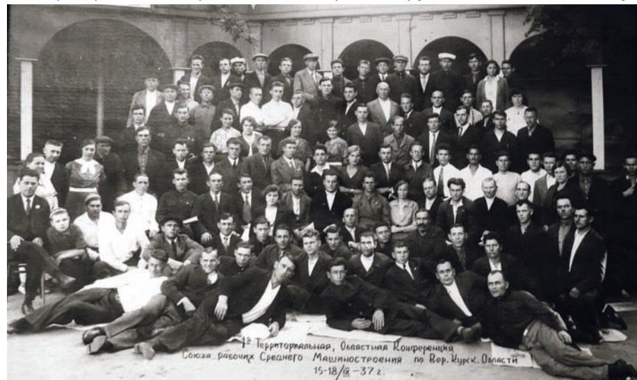
Территориальная, Областная Конференция Союза рабочих Среднего Машиностроения по Вер. Курск, Орловская 15-18/IX-37 г.