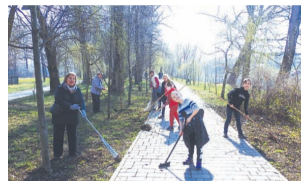
Территория спорткомплекса «Труд» засыпается чистой землей

20 апреля 2019 года во всех муниципальных образованиях в рамках акции прошли санитарно-экологические субботники. В них традиционно приняли участие члены профсоюзов. Областные отраслевые организации профсоюзов, Координационные советы организаций профсоюзов муниципальных образований проводят большую организаторскую работу по активизации участия профсоюзных организаций в этой акции. Намечены планы мероприятий по наведению порядка на общественных, ведомственных территориях, местах отдыха населения.