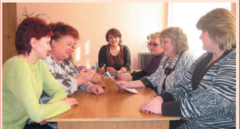
Идет расширенное заседание профкома

Специфика детского дома-интерната предполагает спокойную рабочую обстановку в коллективе, отсутствие конфликтов и недопонимания, так как каждый из нас должен не просто дать знания, обеспечить должный уход детям с физическими недостатками, но и создать для них атмосферу радости, домашнего тепла и уюта. Поэтому деятельность профкома не концентрируется лишь на защите социально-экономических прав и гарантий работников. В нашем учреждении в большей степени востребована деятельность профактива по организации досуга, культурного отдыха членов Профсоюза, чествованию именинников и юбиляров. Уверенности в профсоюзной работе придает и внимание со стороны областного комитета Профсоюза.